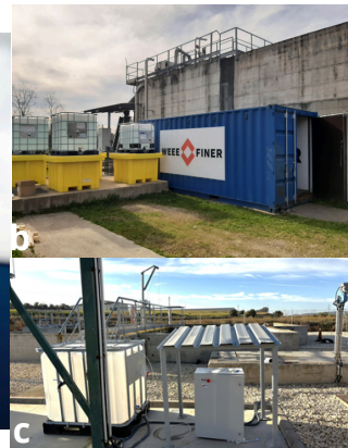
Impianti pilota per la rimozione e il monitoraggio di CoEC presso: (a) Cipro (Limassol), (b) Italia (Torino, Brandizzo) e (c) Spagna (San Esteban De Litera).